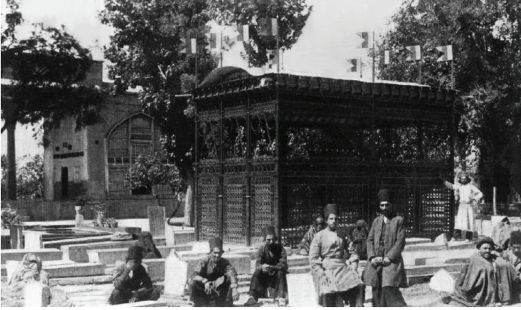
الحافظية في مدينة شيراز، حيث ضريح حافظ الشيرازي.

فهذه إحدى قطعه التي لا تفسر في جملتها إلا بالمعاني الصوفية. وهي من الأبيات التي يرمي بها الوجد أحياناً، فيُغَلَّب حافظ على تقنُّعه وتحجُّبه، فقد عزم على أن يبوح بالسر ولو كان في هذا قتله. وإن قتل فلن يحوِّله القتل عن هذا الإدراك الذي أحاط به، وتغلغل في سريرته، وسرى في دمه، فلو سال دمه على الأرض ما دلَّ إلا على هذا المعنى، وما رسم على الأرض إلا الكلمة الناطقة بالفناء، والتي صلب بها الحلاج «أنا الحق»، بل يخشى حافظ مما ثار نفسه هذه الليلة أن يمحي.